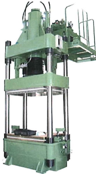
■ MB-U0 300型